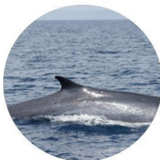
Rorqual comú Balaenoptera physalus