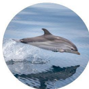
Dofí ratllat Stenella coeruleoalba