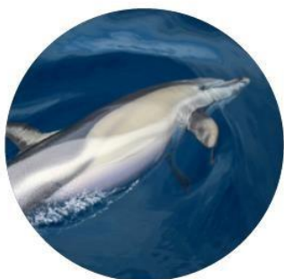
Dofí comú Delphinus delphis

Algunes de les espècies de cetacis de la Mediterrània es troben amenaçades i en perill d'extinció. No apropar-s'hi i gaudir-ne amb uns bons prismàtics ajuda a la seva conservació!