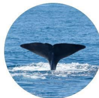
Catxalot Physeter macrocephalus